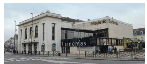
UGC Majestic, février 2019

Devenu vétuste, le théâtre sera entièrement rénové à partir de 1933 pour prendre la forme que nous lui connaissons aujourd'hui. Il deviendra ainsi le "Cinéma Théâtre Majestic" avant de laisser place dans les années 50 uniquement au cinéma "Le Majestic" puis aujourd'hui au "UGC Majestic".