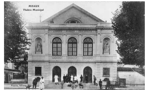
Le théâtre municipal, carte postale, 1910-1920