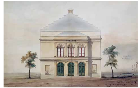
Alexandre Bourla, Premier projet pour l'élévation principale, dessin, 1840, 555 x 625 mm

Suite au succès du cinématographe inventé par Louis Lumière en 1895 et à la démocratisation des projections cinématographiques, M. Catriens, alors concessionnaire du théâtre, propose dès 1913 l'installation d'une salle dédiée uniquement aux projections cinématographiques (plan 12). Face au coût d'une telle opération et suite au déclenchement de la première Guerre Mondiale, le projet ne verra finalement pas le jour. Le théâtre est alors renommé "Théâtre des variétés" ainsi que "American Cinéma Music-Hall", preuve de son succès populaire.