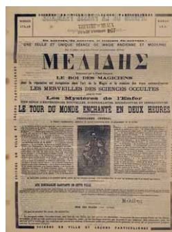
Programme des représentations aux Théâtres de Meaux (19 e siècle)

Devenu vétuste, le théâtre sera entièrement rénové à partir de 1933 pour prendre la forme que nous lui connaissons aujourd'hui. Il deviendra ainsi le "Cinéma Théâtre Majestic" avant de laisser place dans les années 50 uniquement au cinéma "Le Majestic" puis aujourd'hui au "UGC Majestic".