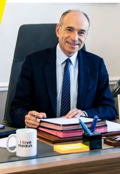
Jean-François Copé Ancien ministre, Maire de Meaux et Président de la Communauté d'Agglomération du Pays de Meaux

10 e des communes d'Île-de-France les plus agréables à vélo.