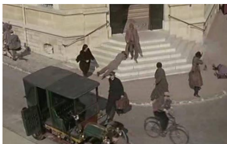
Photographies tournage du film La bande à Bonnot , 1968 - Archives privées.

Le cinéma a toujours été important aussi pour le public Meldois. Le 7 ème art est une source de loisirs et de distractions prisés à toutes époques. Lors des périodes difficiles de notre histoire, le rôle du cinéma a été d'autant plus primordial. C'est le cas, notamment lors de la première guerre mondiale. De nombreux soldats, « les poilus » venaient assister à des séances de cinéma à Meaux afin de s'échapper quelques instants lors de leurs permissions de la dure vie du front. Des soldats parfois indisciplinés au moment de ces séances de cinéma. C'est le cas, le 18 février 1918, comme relaté sur un rapport de police conservé dans notre fonds d'archives où des militaires de la 116 ème compagnie d'infanterie ont fait irruption dans la salle de cinéma Cambey, place du marché, voulant « faire scandale ». Le commissaire de police insulté de « vache » par ces militaires, réussi tout de même à les évacuer de la salle. Fâchés et vexés d'avoir été sortis, les militaires s'emparent de la pancarte du film avant de quitter les lieux.