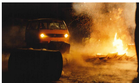
Photographies tournage Hors la vie , 1991, Série FI

Une partie des scènes de ce film a été tournée dans l'ancienne caserne du Luxembourg. Les photographies du tournage sont conservées dans notre fonds d'archives.