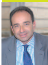
JEAN-FRANÇOIS COPÉ MAIRE DE MEAUX