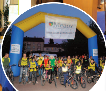
Nocturn'Vélos le 28 mai dernier