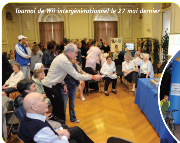
Tournoi de Wii intergénérationnel le 27 mai dernier