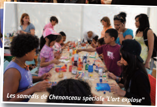
Les samedis de Chenonceau spéciale 'L'art expose'